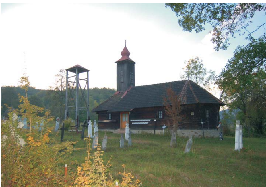
36. Corbești - Biserica de lemn "Nașterea Maicii Domnului"