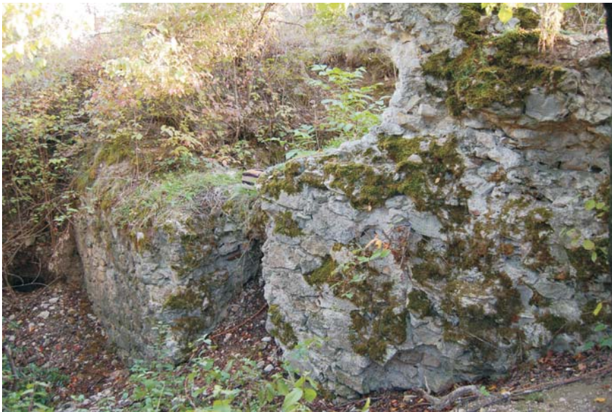
2. Agraşu Mare - "Cetate"