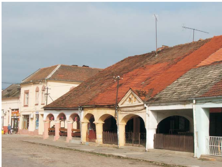
57. Lipova - Bazarul turcesc