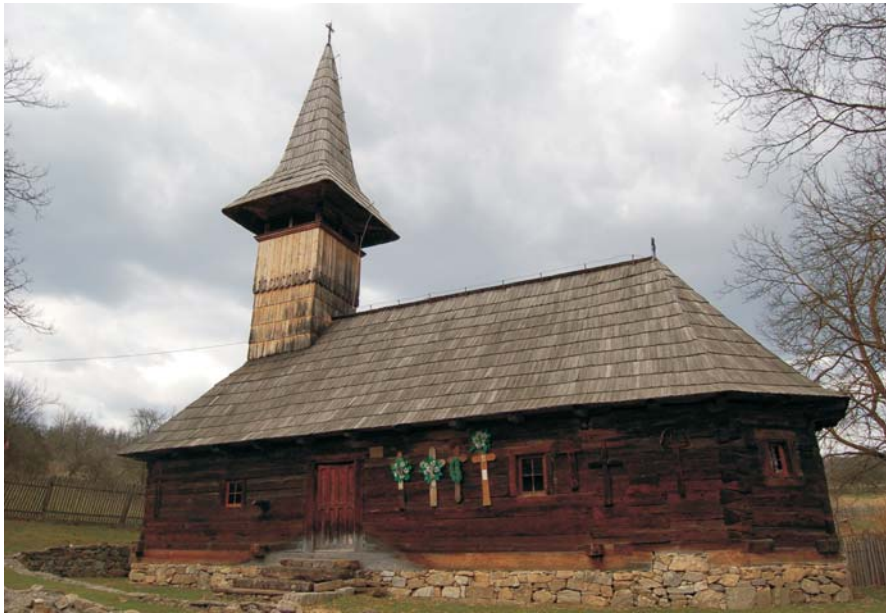
49. Groșii Noi - Biserica de lemn "Întâmpinarea Domnului"