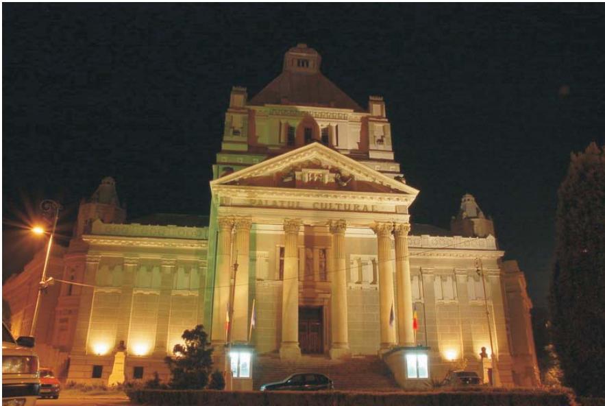
13. Arad - Palatul Cultural