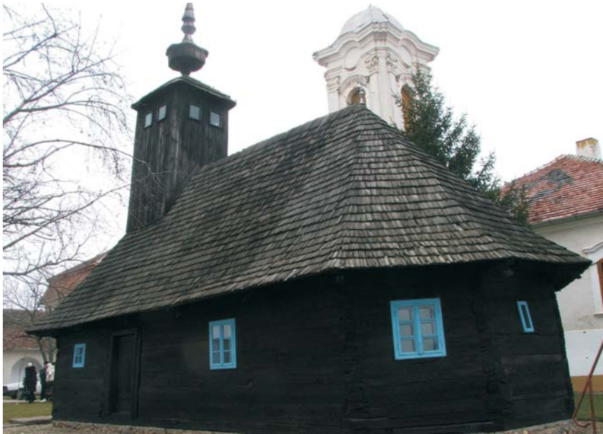
11. Arad - Mănăstirea "Sf. Simeon Stâlpnicul" Gai