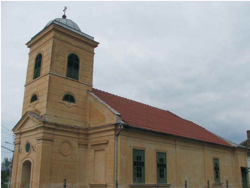
46. Galșa - Biserica "Adormirea M a i c i i Domnului"