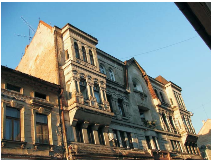
12. Arad - Clădirea Diecezanei