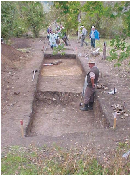
34. Cladova - Situl arheologic "Dealul Carierei"