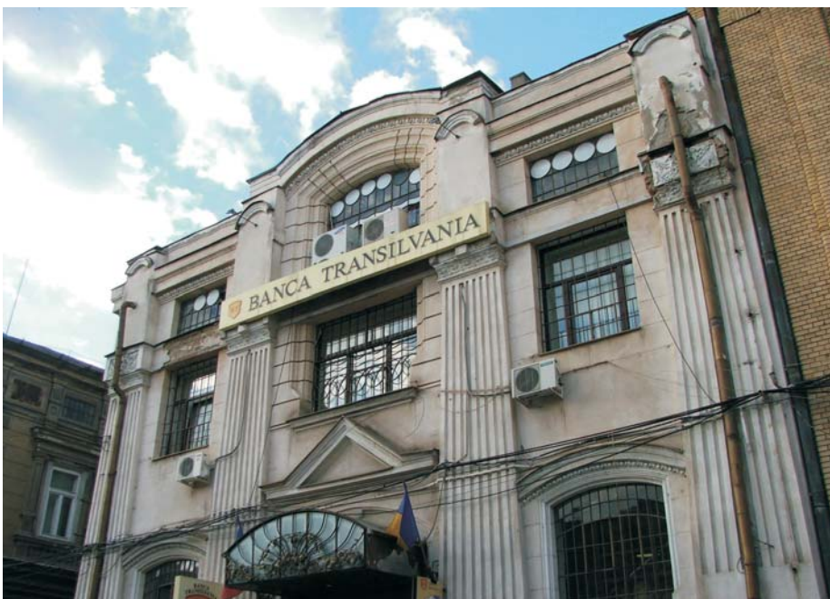
24. Arad - Antrepozit, str. Unirii 5