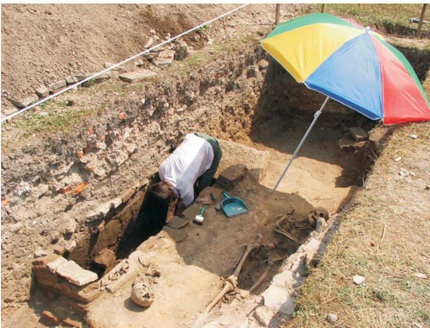
45. Frumușeni- situl arheologic "Mănăstirea Bizere"