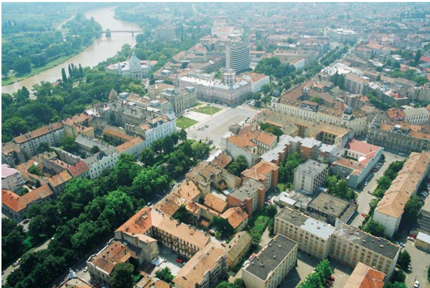
19. Arad - Zona centrală