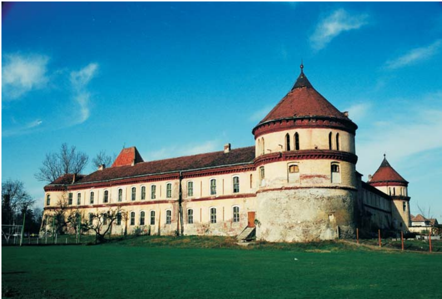
52. Ineu - "Cetatea Ineului"