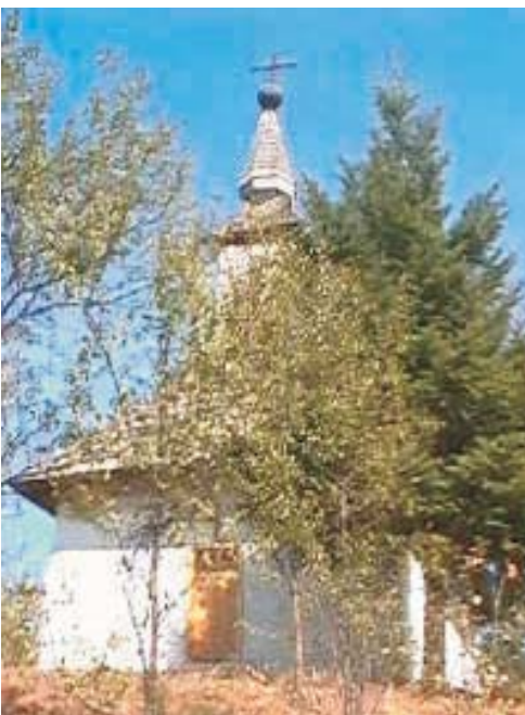
33. Ciunteşti - Biserica de lemn "Buna Vestire"