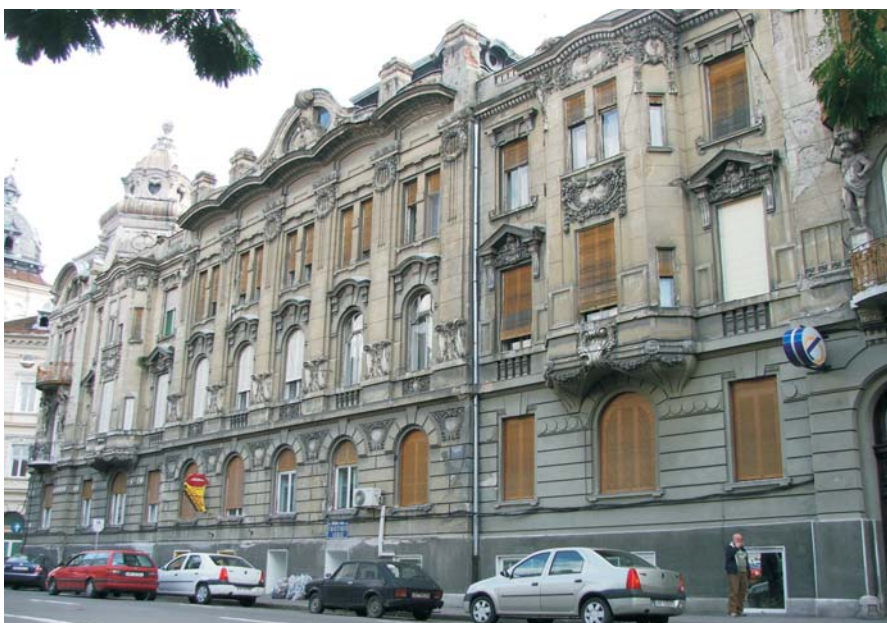
15. Arad - Palatul Szantay