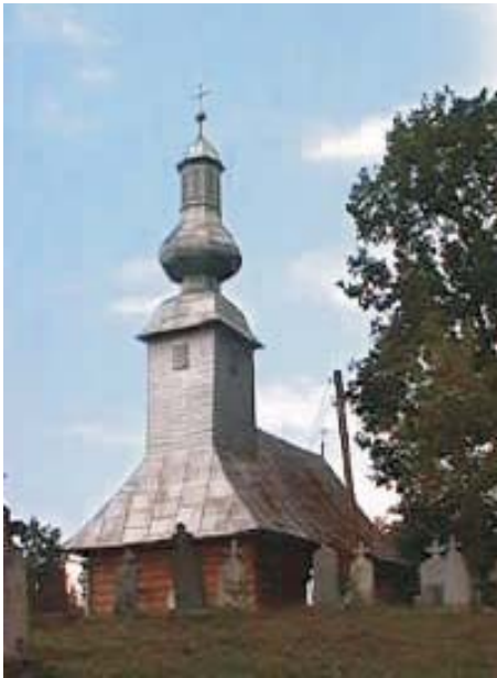
25. Bodești - Biserica de lemn "Pogorârea Duhului Sfânt"