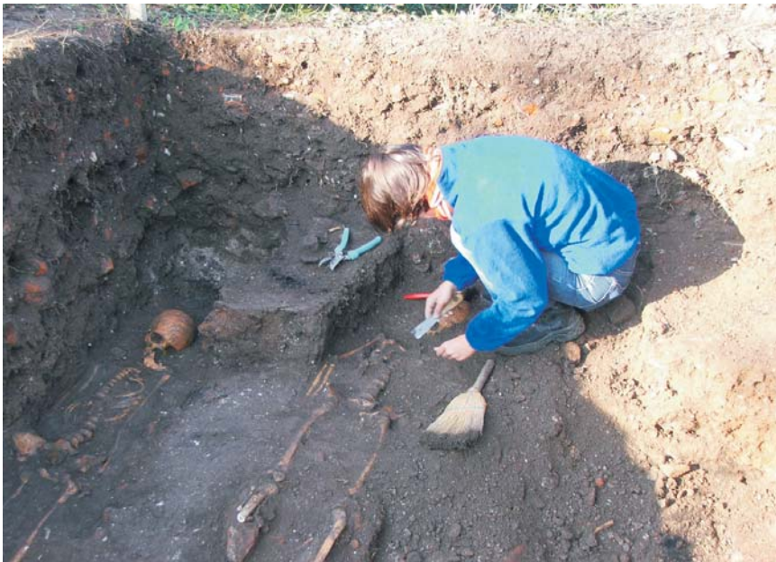
29. Bulci - Situl arheologic