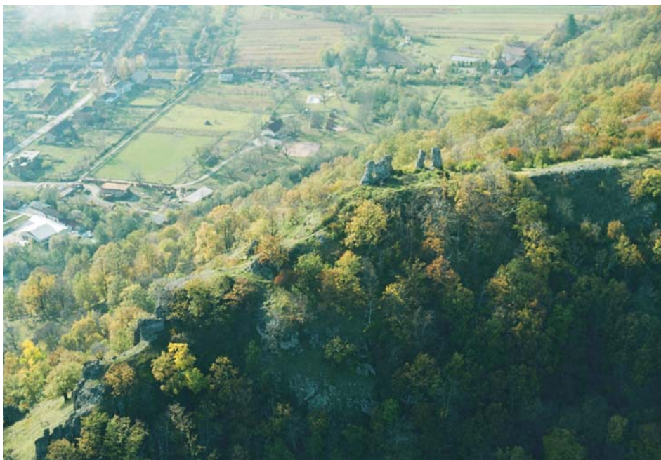
42. Dezna - Cetatea (ruine)