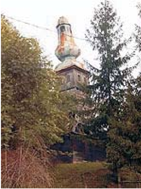
28. Budești - Biserica de lemn "Înălțarea Domnului"