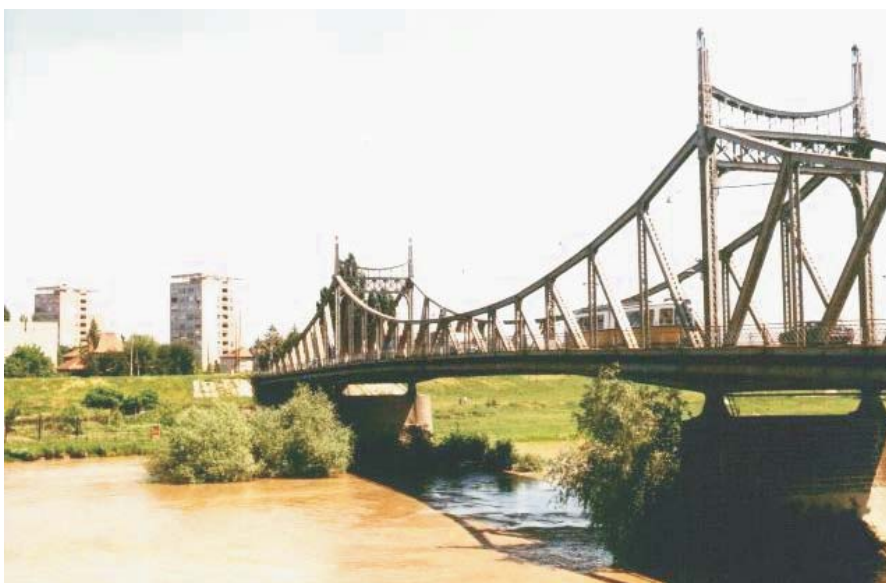
6 . A r a d - P o d u l " T r a i a n "