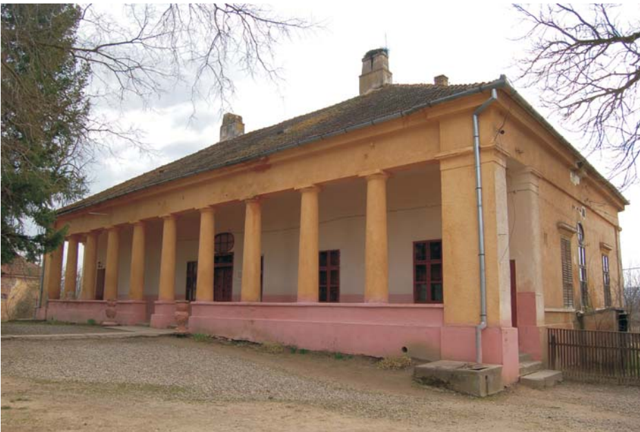
35. Conop - Conacul "Ștefan Cicio-Pop"