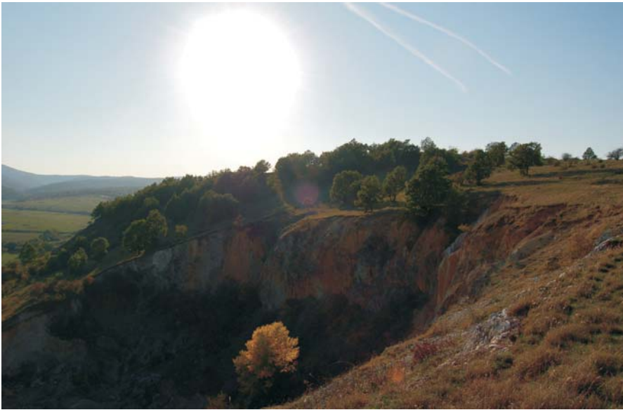
1. Agraşu Mare - "Cetate"