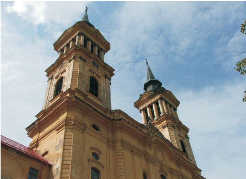
56. Lipova - Mănăstirea "Sf. Maria" Radna