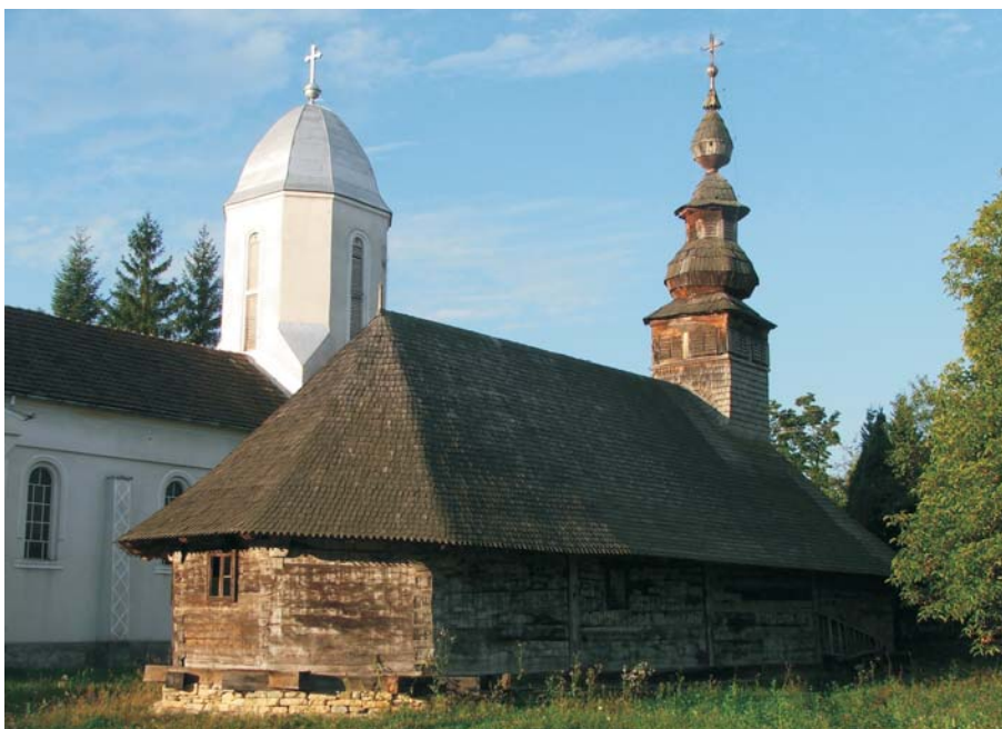
54. Julița - Biserica de lemn "Intrarea Maicii Domnului"