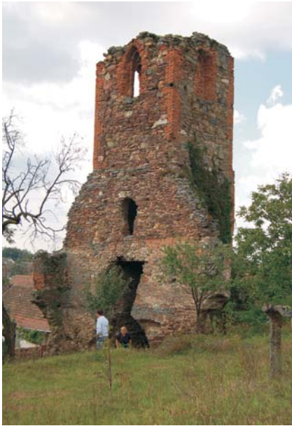
37. Covăsânț - Turn de biserică