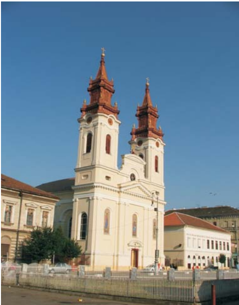
8. Arad - Catedrala română ortodoxă "Sf. Ioan Botezătorul"