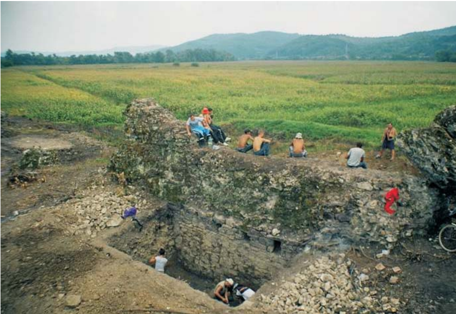
32. Chelmac - Zidurile Mănăstirii "Eperyes"