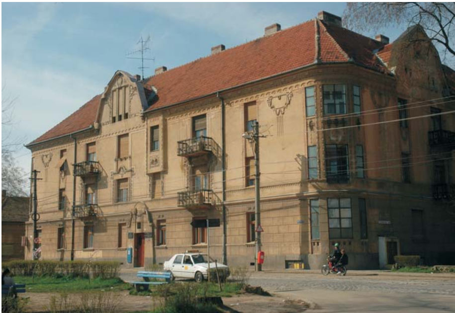
23. Arad - Palatul sârbesc