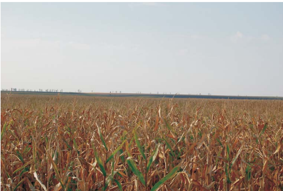
39. Cruceni - Așezare "Movilă Teșită"