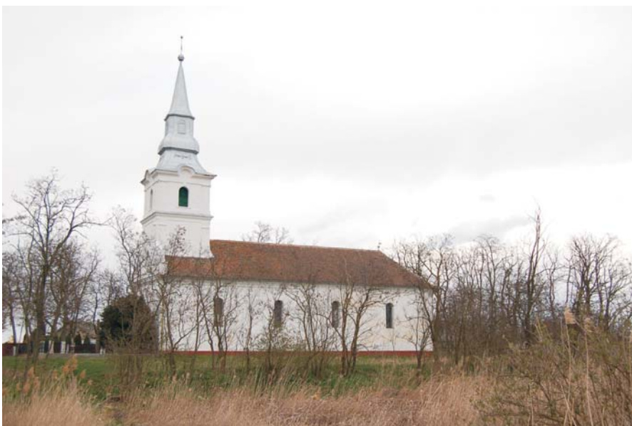
51. Iermata Neagră - Biserica reformată (calvină)