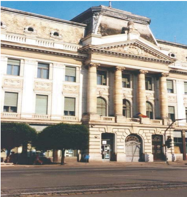
20. Arad - Palatul Băncii Naționale