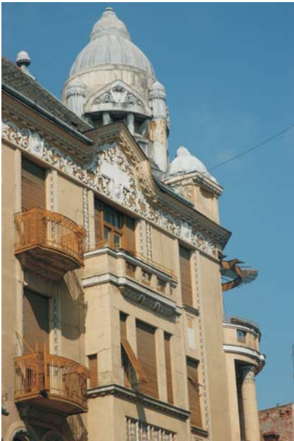
14. Arad - Palatul Bohuş