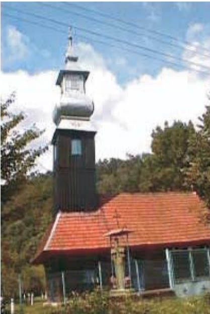
38. Cristești - Biserica de lemn "Sf. Arhangheli Mihail și Gavril"