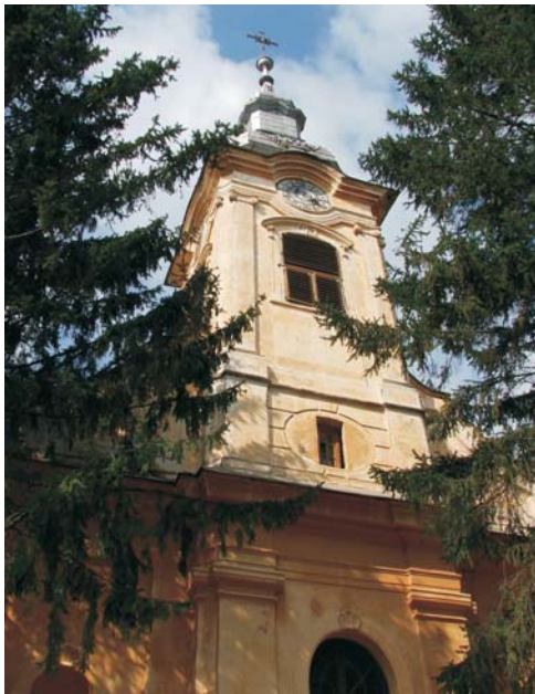
47. Ghoroc - Biserica "Sf. M u c e n i c Dimitrie"