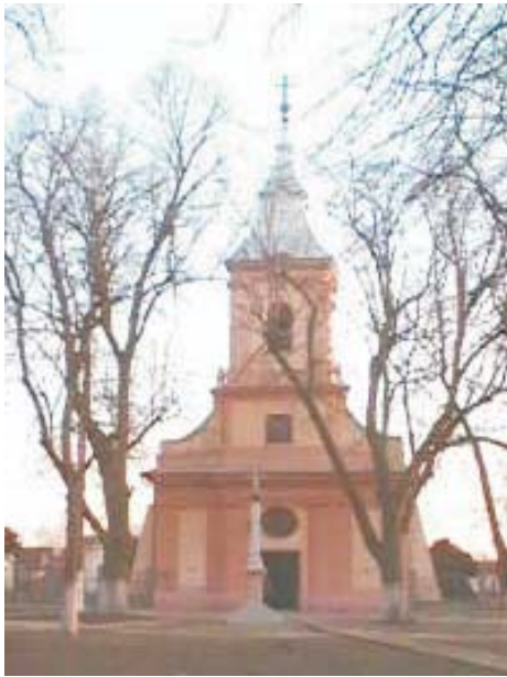
43. Fântânele- Biserica romano- catolică "Îngerul Păzitor"