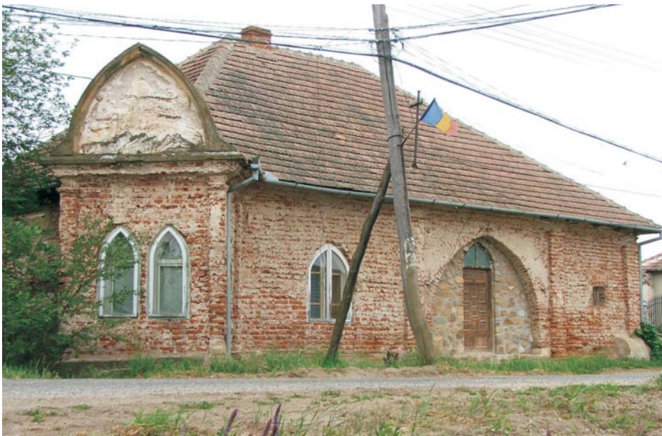
40. Cuvin - Casa "Sava Tekelya"