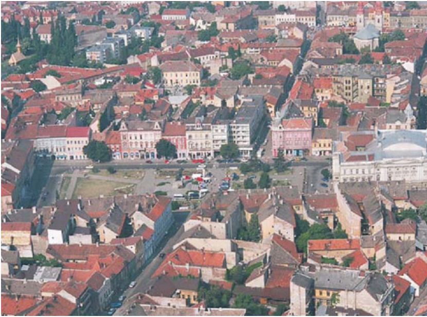
7. Arad - ansamblul urban Piața "Avram Iancu"