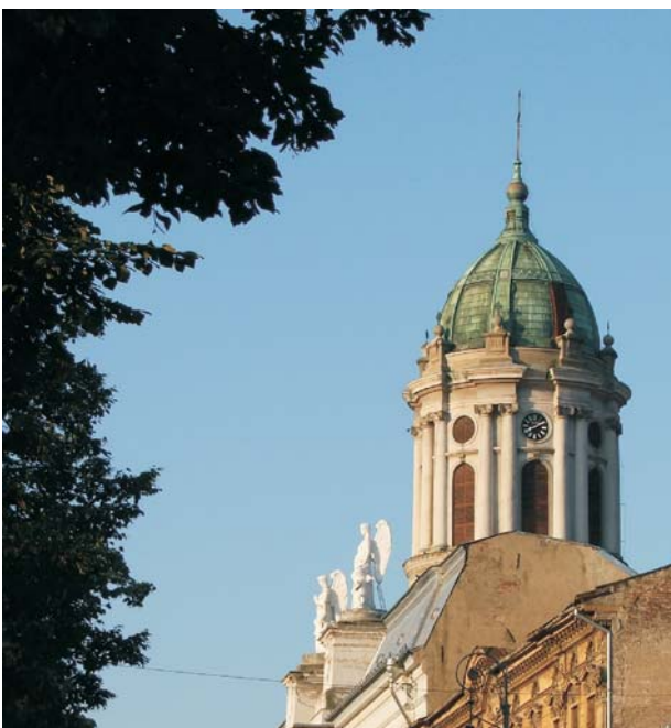
21. Arad - Biserica romano-catolică