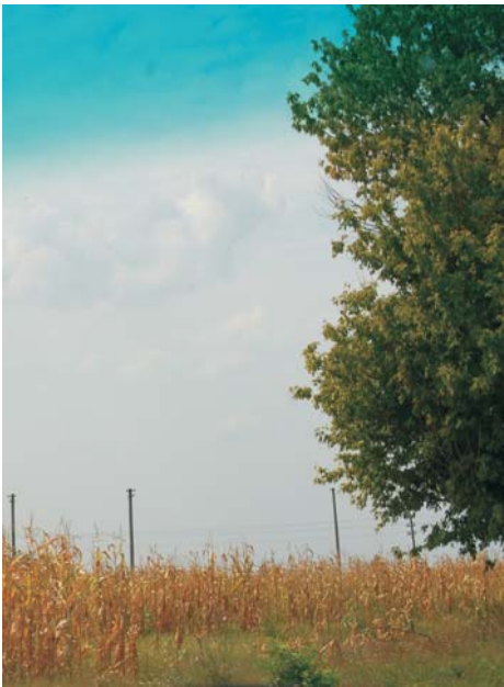
44. Felnac - Situl arheologic