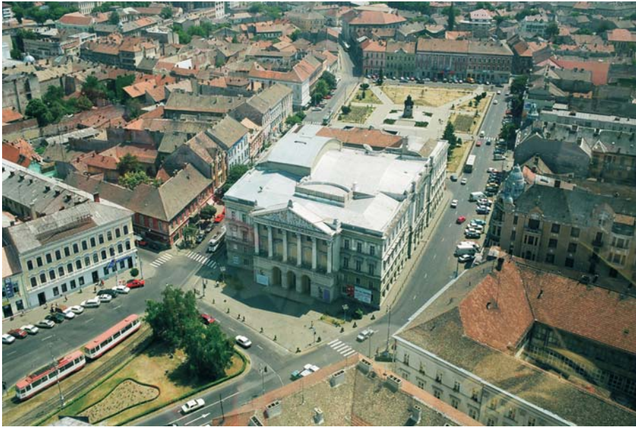
22. Arad - Teatrul Clasic "Ioan Slavici"