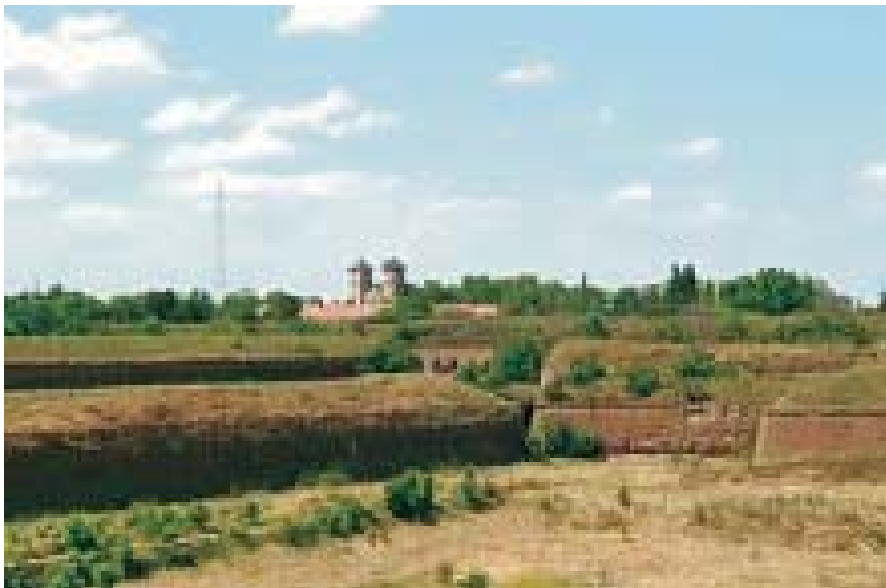
5 . A r a d - C e t a t e a A r a d u l u i , M ă n ă s t i r e a " F r a n c i s c a n ă "