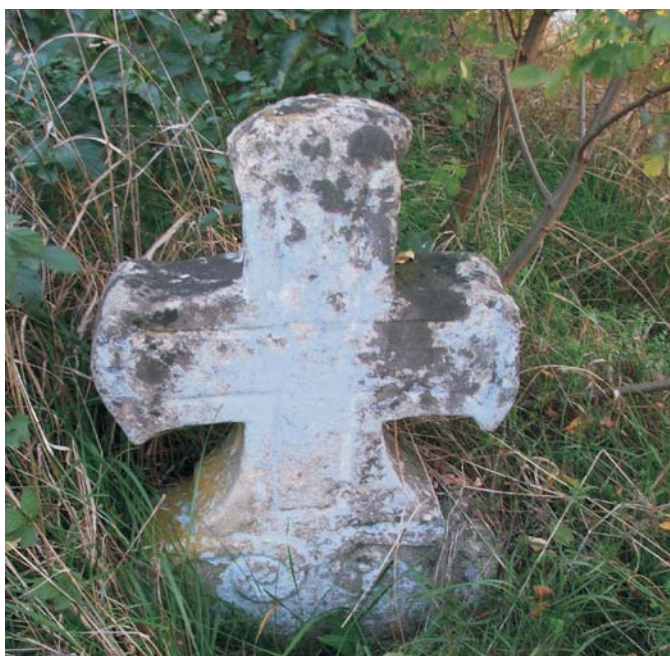
3. Agraşu Mic - Cimitir