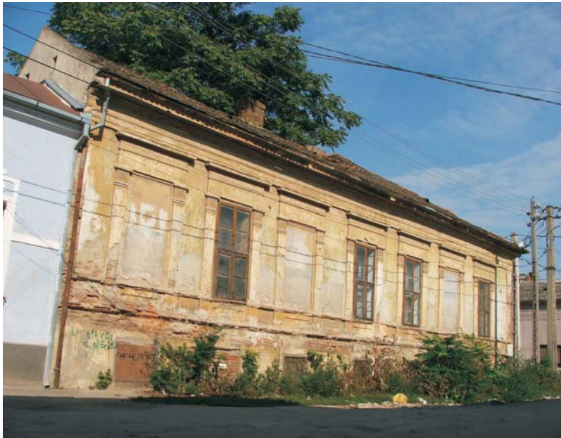
17. Arad - "Preparandia Română"