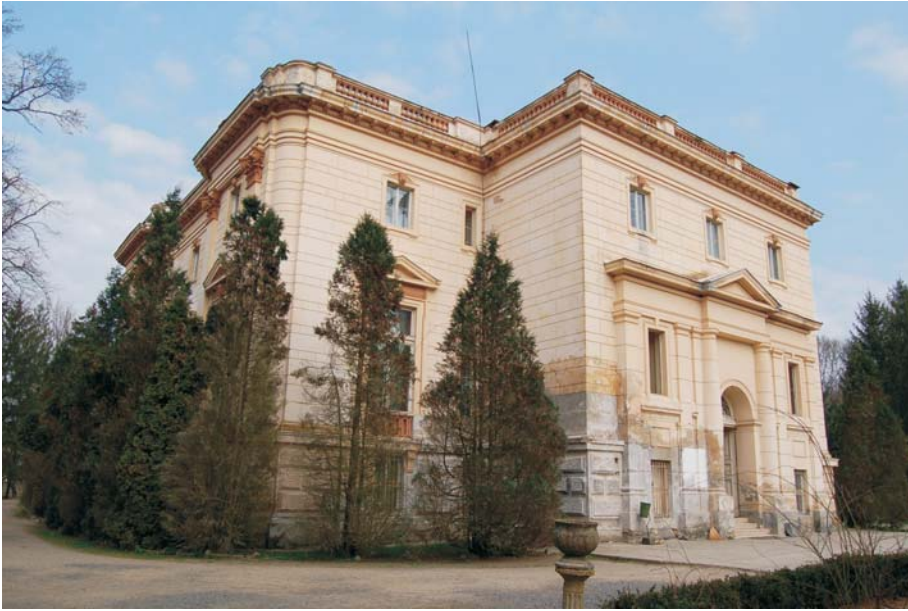
31. Căpâlnaş - Castelul "Teleki"