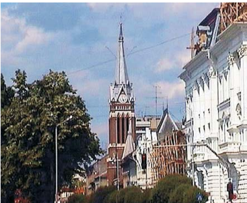
18. Arad - Biserica evanghelică luterană