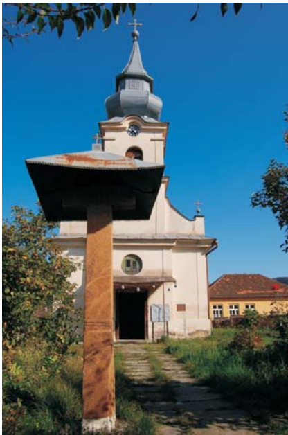
41. Dezna - Ansamblul bisericii "Pogorârea Duhului Sfânt"