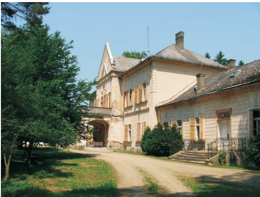
30. Bulci - Castelul Mocioni