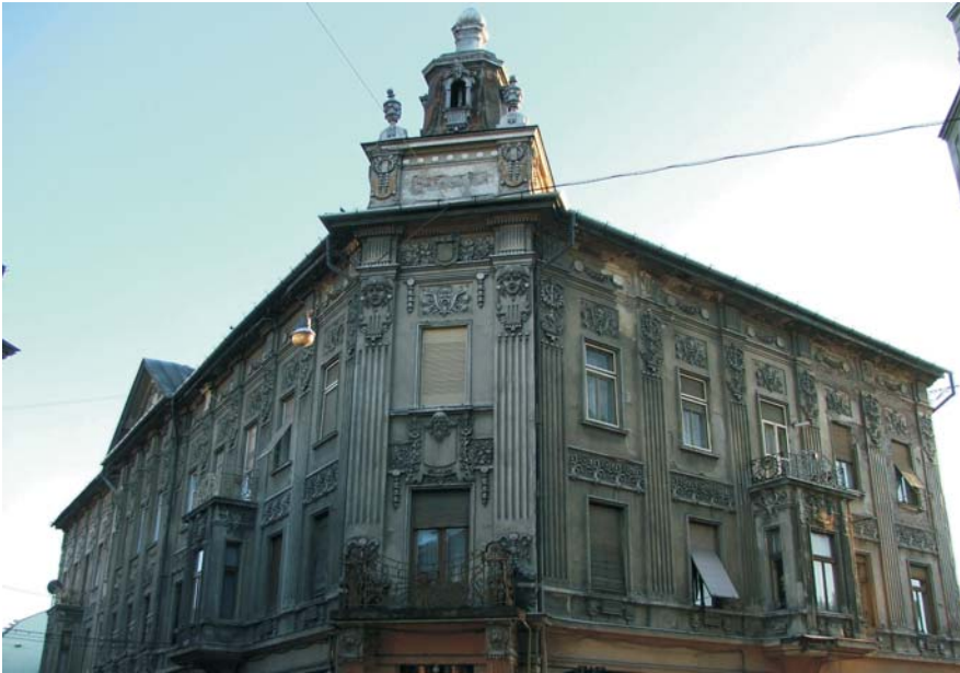
10. Arad - Casă 1908 (cu farmacie), Str. ȘtefanCicio-Pop 16