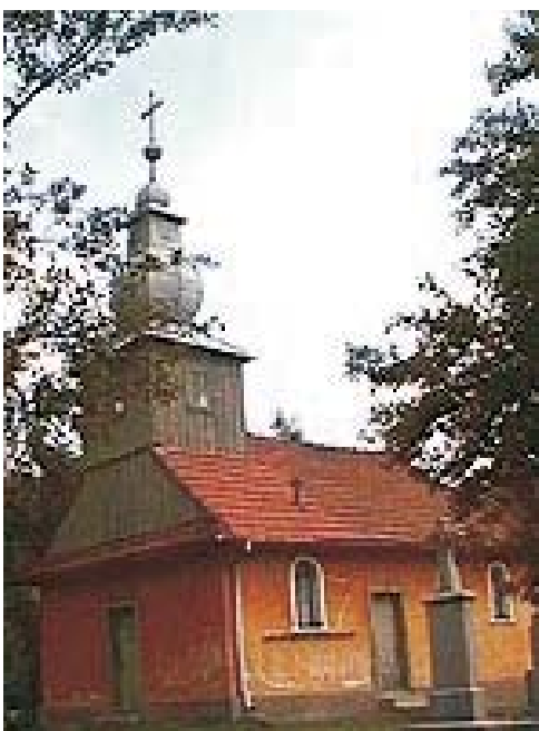
48. Groși - Biserica de lemn " Î n ă l ț a r e a Domnului"