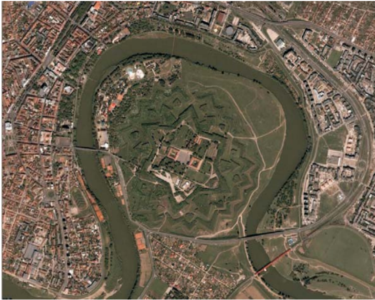
4 . A r a d - " C e t a t e a A r a d u l u i "