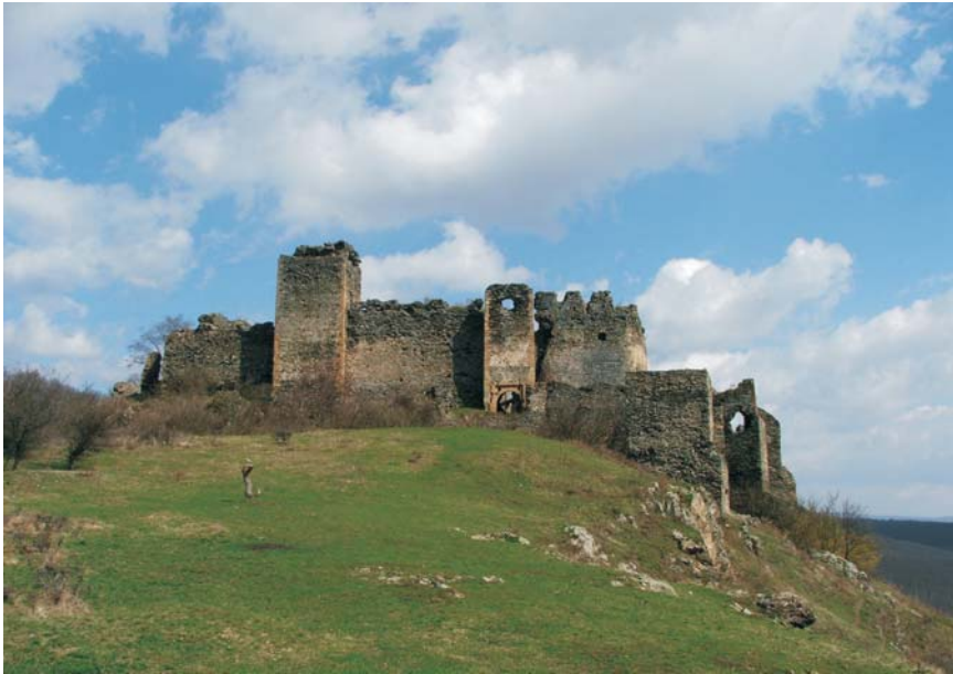
55. Lipova - Cetatea "Șoimoș"