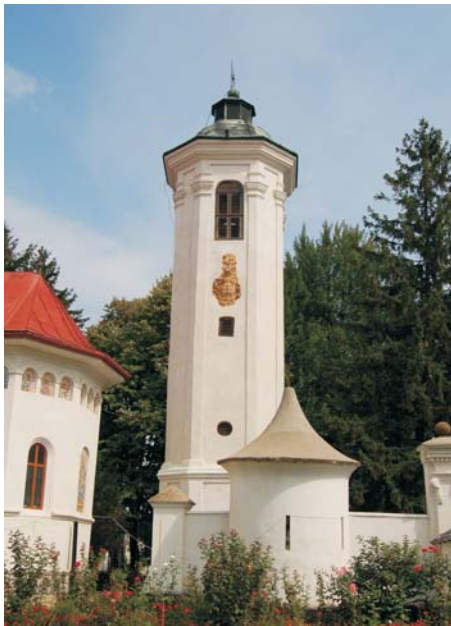
26. Bodrogu N o u - Mănăstirea "Adormirea M a i c i i Domnului"