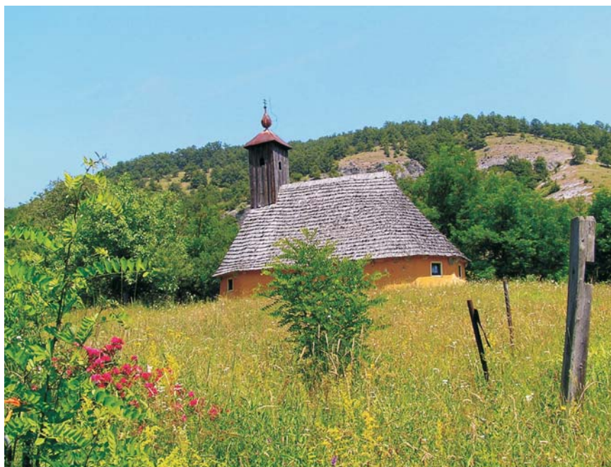
27. Buceava Ș o i m u ș - Biserica de lemn "Sf. Mucenic Dimitrie"