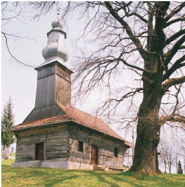
53. Ionești - Biserica de lemn "Sf. Mucenic Gheorghe"