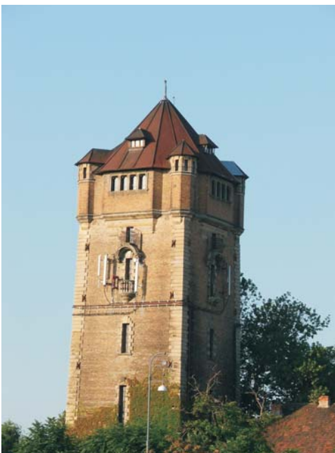
9. Arad - Turnul de apă