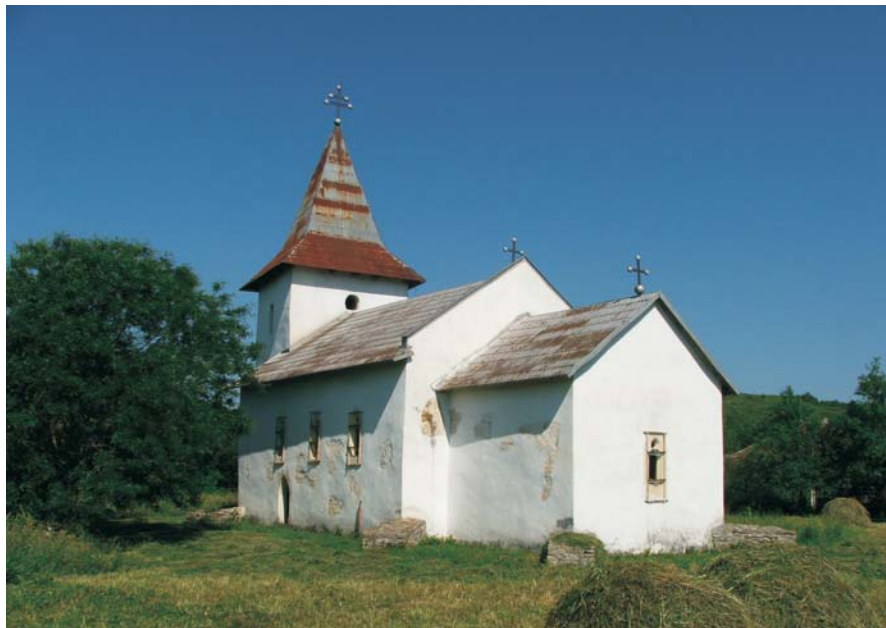
50. Hălmagiu - Biserica Voievodală "Adormirea Maicii Domnului"